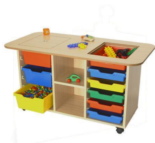
Mueble Escolar Gavetero para Actividades altura 65 cm