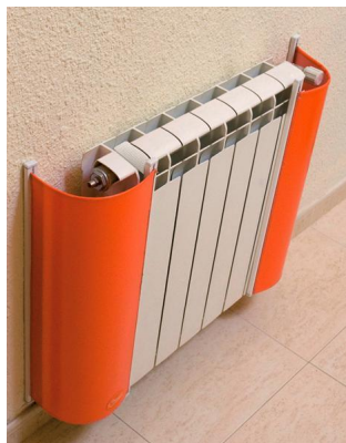
Proteccion Radiador Guarderías Semi-rígida Colores